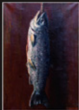
「Saumon Sale」 1961年