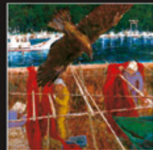
「生きるII」 (第2回大王大賞作品)