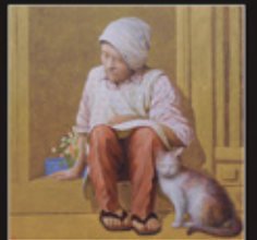
「陽だまり図」 (第7回大王大賞作品)