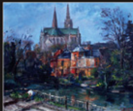
「寺院とユール河」 1959年