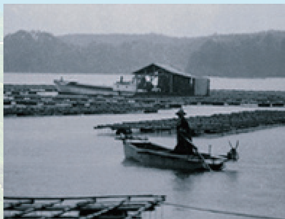
真珠養殖場の様子(1958年)

1905年、御木本幸吉が日本で初めて、ここ志摩の地で真円(球体)真珠の養殖に成功し、その技術は日本全国のみならず世界中に広まりました。