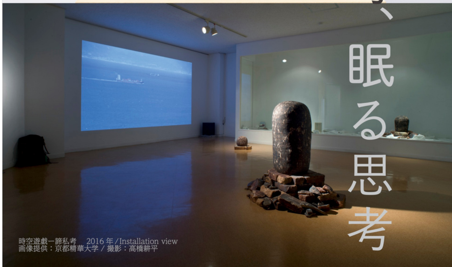
時空遊戯—諦私考 2016年/Installation view

Melt(20230613) 2023年/陶土、磁土、釉薬、オルトソコーン他/33×26×38cm