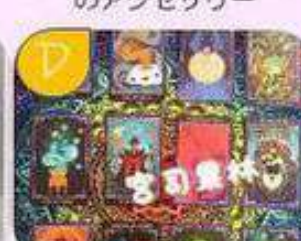
手相・タロット占い