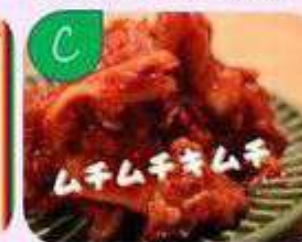
白菜農家を作る白菜 キムチとヤンニョム