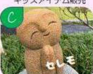
キャンドル販売と 当日お楽しみ販売