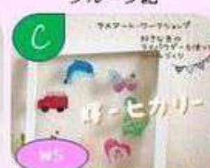
キラキラシール作り