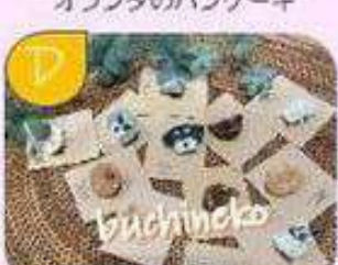
動物モチーフの アクセサリー