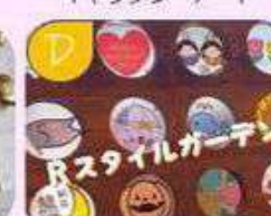
ガラスアート展示 花デコ砂コサージュ展示販売