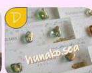
あこや真珠とシーグラス のアクセサリー