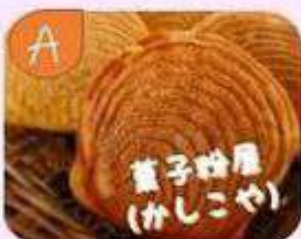
あこや貝の形の焼きまんじゅう 「かしこ焼き」