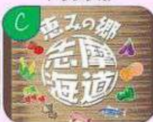
旬の野菜・スイーツ