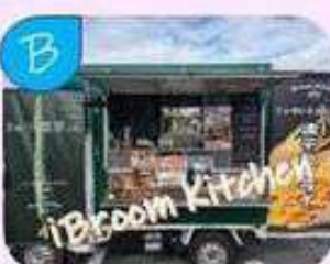
ジャガイモから作る ポテトフライ