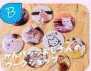
うちの子缶バッジ