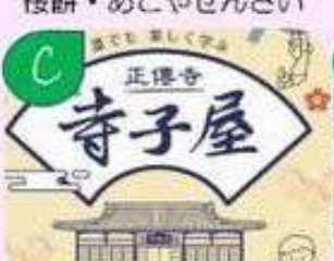
寺子屋茶屋 抹茶ラテ チャイ オランダのパンケーキ