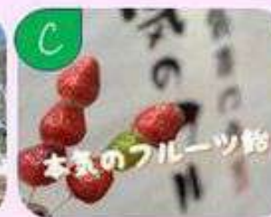
パリッとジューシーな フルーツ飴