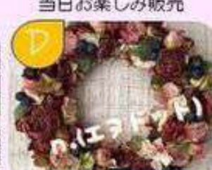
オールシーズン楽しめる 造花の雑貨