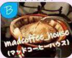
自家焙煎コーヒー