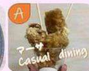
からあげ、ヤンニョムチキン、 チュモッパおにぎり、レモネード