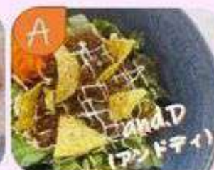
タコライス丼と ソーダボンチ