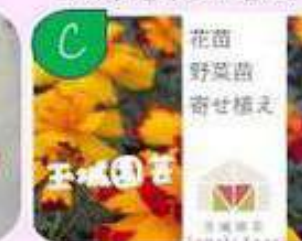
季節の花苗、野菜苗 季節の寄せ植え