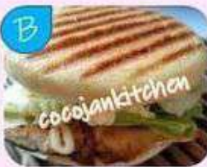
オリジナルサンドと ドリンク類