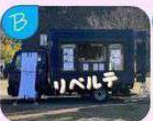
フランス料理と イタリア料理