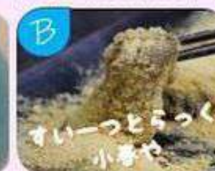
大阪北新地小暮やのわらび餅 や冷凍スイーツ、ドリンク