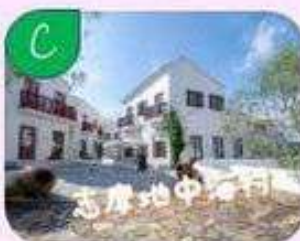
志摩地中海村オリジナル 焼き菓子など