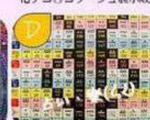
マヤ歴鑑定・手相鑑定