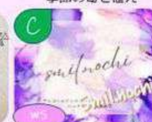
アルコールインクアート ギャラクシーアート