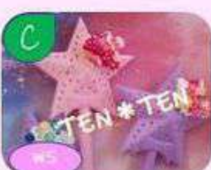
スイーツデコ、 キッズアイテム販売