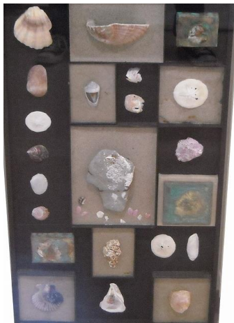
横地 洋司 顔のある砂浜