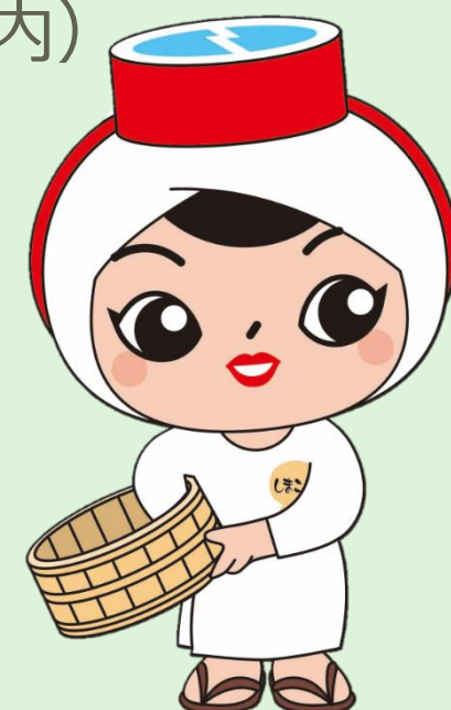
志摩市公式PRキャラクター しまごさん