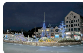
鵜方駅前イルミネーション