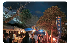
鵜方ちびっ子祭り

地域の皆様にはこれからも鵜方振興会活動に対しましてご理解とご協力を賜りますようお願い申し上げます。